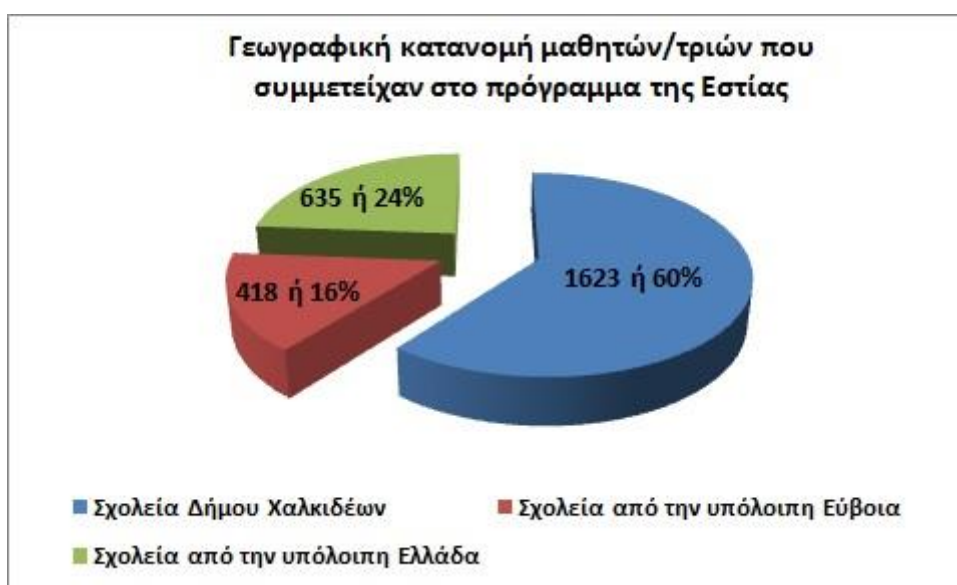
Εικόνα 1: Γεωγραφική κατανομή των μαθητών/μαθητριών που συμμετείχαν στο πρόγραμμα της Εστίας κατά το σχολικό έτος 2017-18

Στην εικόνα 1 παρουσιάζεται η γεωγραφική κατανομή των συμμετασχόντων σχολικών τμημάτων και μαθητών.