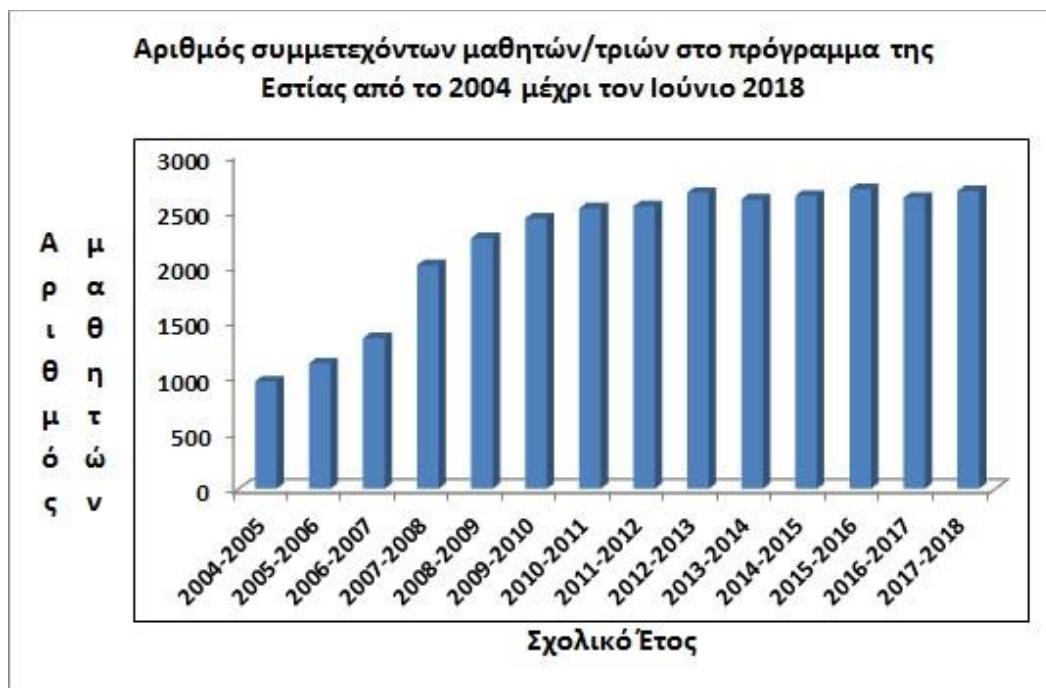
Εικόνα 2: Αριθμός των μαθητών που συμμετείχαν στο πρόγραμμα της Εστίας Γνώσης και Πολιτισμού Χαλκίδας από το σχολικό έτος 2004-05 μέχρι και το σχολικό έτος 2017-18. Είναι εμφανής η παγίωση του αριθμού των επισκεπτών, τα τελευταία έξι χρόνια, πάνω από τους 2600.