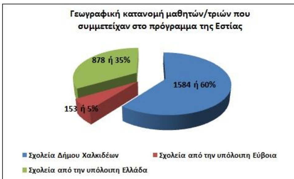
Εικόνα 1: Γεωγραφική κατανομή των μαθητών/μαθητριών που συμμετείχαν στο πρόγραμμα της Εστίας κατά το σχολικό έτος 2018-19

Στην εικόνα 1 παρουσιάζεται η γεωγραφική κατανομή των συμμετασχόντων σχολικών τμημάτων και μαθητών. Είναι χαρακτηριστική η εντυπωσιακή αύξηση των συμμετεχόντων σχολείων εκτός Ευβοίας η οποία σε σχέση με την περυσινή χρονιά υπερδιπλασιάστηκε (16% το 2017-18 στο 35% το 2018-19).