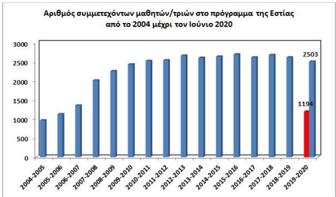
Εικόνα 2: Αριθμός των μαθητών που συμμετείχαν στο πρόγραμμα της Εστίας Γνώσης και Πολιτισμού Χαλκίδας από το σχολικό έτος 2004-05 μέχρι και το σχολικό έτος 2019-20. Στο σχολικό έτος 2019-20 η κόκκινη μπάρα απεικονίζει τον αριθμό των επισκεπτών μέχρι 15 Μαρτίου και η μπλε τον αναμενόμενο, σύμφωνα με τις κρατήσεις των σχολείων, υπό κανονικές συνθήκες. Σε κάθε περίπτωση είναι εμφανής η παγίωση του αριθμού των επισκεπτών, τα τελευταία 10 χρόνια, πάνω από τους 2500.