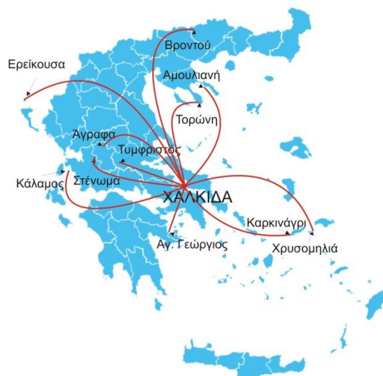
Εικόνα 4: Γεωγραφική θέση των oligothésion δημοτικών σχολείων της ηπειρωτικής και νησιωτικής χώρας που συμμετέχουν στο πρόγραμμα «ΤηλεΤαξή» της Εστίας Γνώσης Χαλκίδας

Στην εικόνα 4 απεικονίζεται η γεωγραφική θέση των σχολείων.